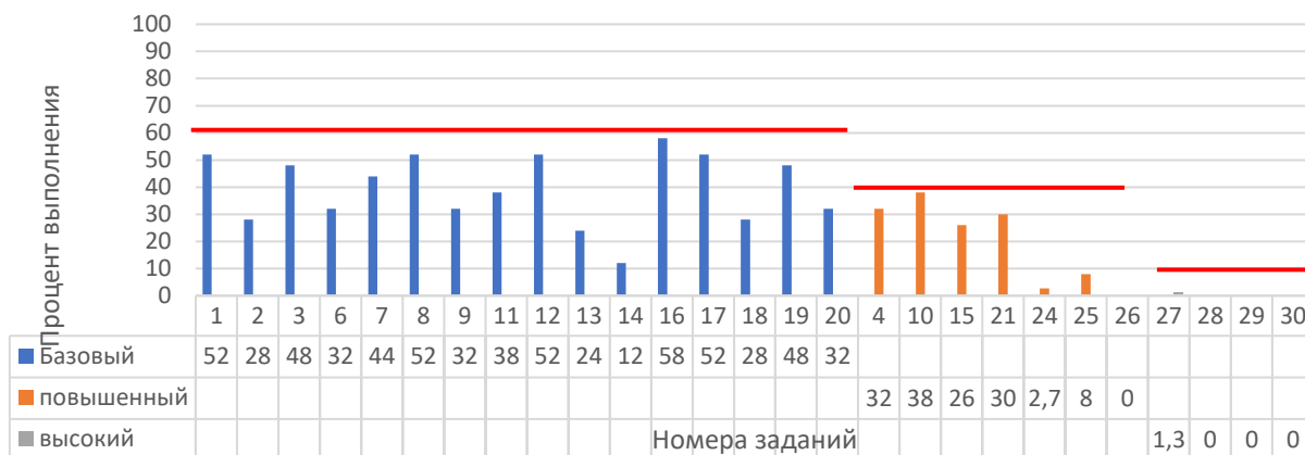
Рисунок 2. Задания, по которым участники не преодолели минимальный порог

На рисунке 2 представлены данные по заданиям (%), уровень выполнения которых не преодолел минимальный порог. Красной линией отражен минимальный порог выполнения для каждого уровня сложности: базовый – 60%, повышенный – 40%, высокий – 10%.