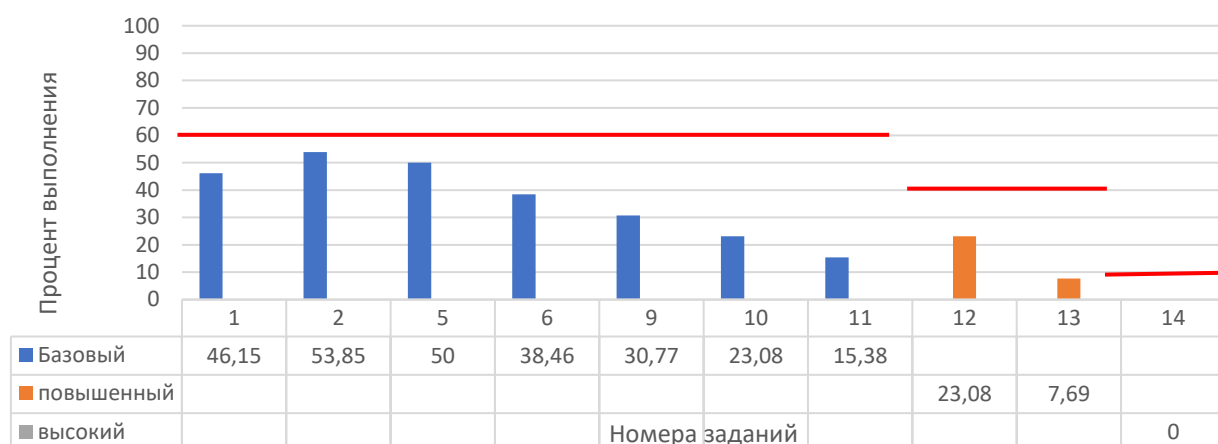
Рисунок 5. Задания, по которым участники не преодолели минимальный порог

На рисунке 5 представлены данные по заданиям (%), уровень выполнения которых не преодолел минимальный порог. Красной линией отражен минимальный порог выполнения для каждого уровня сложности: базовый – 60%, повышенный – 40%, высокий – 10%.