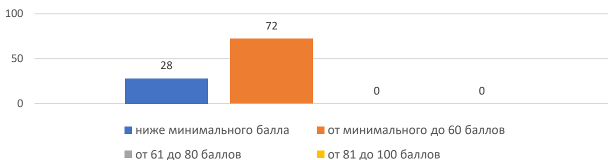
Рисунок 1. Основные результаты ЕГЭ по физике

Основные результаты ЕГЭ по физике в Хорольском муниципальном округе в 2023 году представлены на рисунке 1. В 2023 году в образовательных организациях (далее – ОО) муниципалитета не было выпускников, получивших на экзамене по физике 100 баллов.